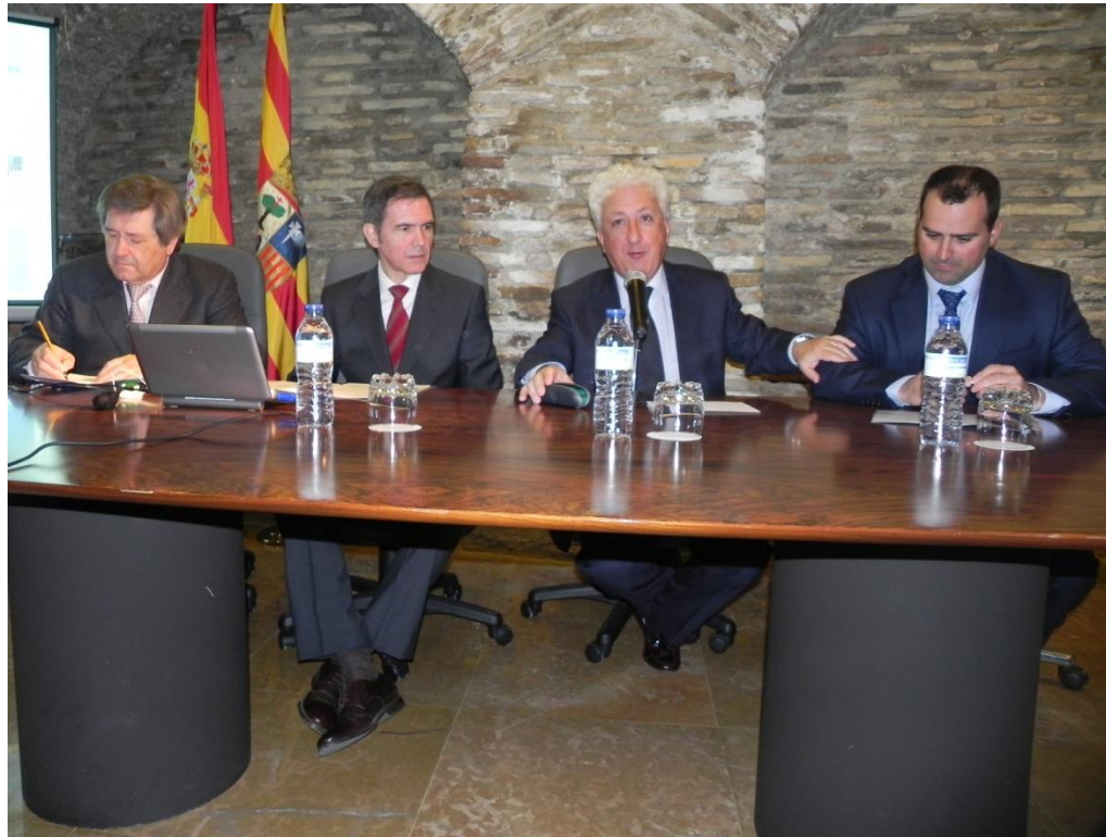
Palacio Armijo (Sede del Justicia de Aragón) – Zaragoza, 26 de enero de 2012 I Jornada Aragonesa de Transporte Interurbano de Aragón